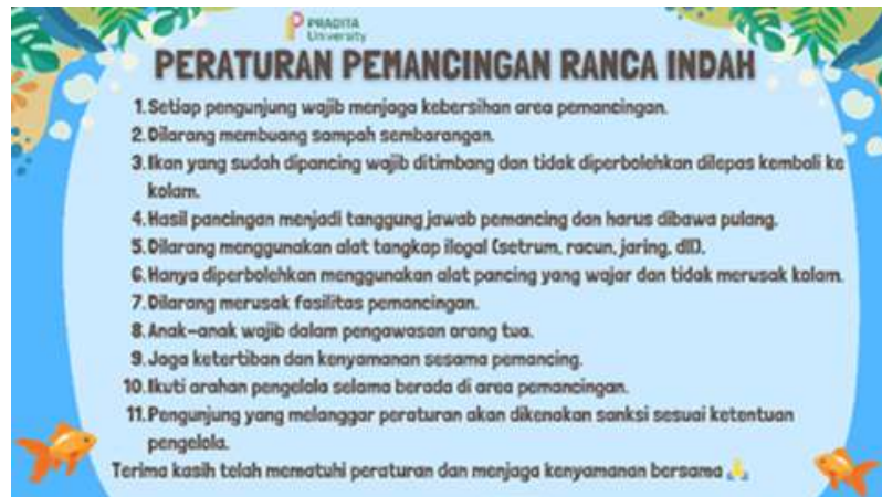
Gambar 3. Peraturan Pemancingan di Kampung Wisata Tematik Ranca Indah

meningkatkan keberlanjutan destinasi wisata serta memberikan manfaat ekonomi bagi masyarakat setempat ( Yunita et al., 2024 ). Sebagai bentuk implementasi pengelolaan atraksi pemancingan yang melibatkan masyarakat serta menjaga ketertiban dan keberlanjutan lingkungan wisata, berikut ditampilkan peraturan pemancingan yang berlaku di Kampung Wisata Tematik Ranca Indah sebagai pedoman bagi pengunjung dalam melakukan aktivitas wisata.