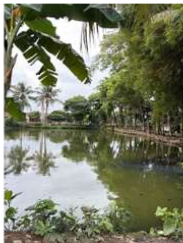
Gambar 2. Area Pemancingan di Kampung Wisata Tematik Ranca Indah

Berdasarkan hasil observasi lapangan yang dilakukan di Kampung Wisata Tematik Ranca Indah Serpong, atraksi pemancingan memiliki potensi yang cukup besar untuk dikembangkan sebagai daya tarik wisata buatan. Atraksi pemancingan tidak hanya menawarkan aktivitas rekreasi bagi pengunjung, tetapi juga memberikan pengalaman wisata yang bersifat santai dan interaktif. Aktivitas memancing sering kali menjadi pilihan wisata keluarga maupun komunitas karena dapat dilakukan oleh berbagai kalangan usia serta memberikan pengalaman rekreasi yang menyenangkan. Keberadaan atraksi wisata merupakan salah satu komponen penting dalam pengembangan destinasi wisata. Atraksi wisata yang menarik dapat meningkatkan minat wisatawan untuk datang dan melakukan kunjungan ke suatu destinasi wisata. Penelitian menunjukkan bahwa atraksi wisata memiliki pengaruh yang signifikan terhadap minat berkunjung wisatawan karena atraksi merupakan alasan utama wisatawan memilih suatu destinasi sebagai tujuan perjalanan mereka ( Nurbaeti et al., 2022 ). Untuk memberikan gambaran nyata mengenai kondisi atraksi pemancingan di Kampung Wisata Tematik Ranca Indah Serpong, berikut disajikan dokumentasi visual yang menunjukkan suasana lokasi serta lingkungan sekitar sebagai bagian dari daya tarik wisata yang ditawarkan.