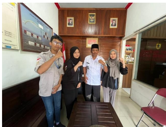
Gambar 1. Wawancara bersama salah satu narasumber “Potret”

Program “Potret” berorientasi pada kebutuhan informasi publik terkait potensi wisata dan sosok inspiratif masyarakat lokal. Dalam konteks media penyiaran, pemahaman karakteristik pendengar merupakan fase krusial untuk menentukan isi program sehingga relevan dan mudah diterima oleh pendengar. Pada penelitian lain menunjukkan pentingnya variasi konten siaran yang disesuaikan dengan segmentasi pendengar agar promosi destinasi wisata efektif dan menjangkau kelompok audiens yang lebih luas (Nurul Pratiwi, 2021).