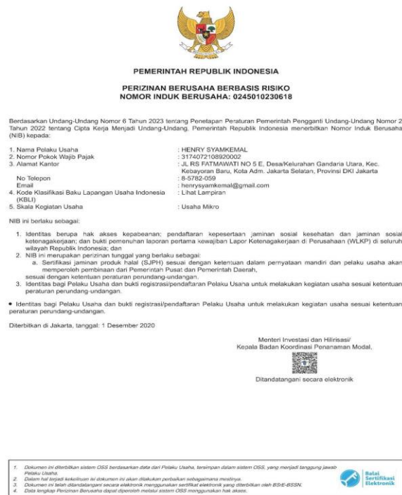
Gambar 2. NIB Gorengan Nusantara.