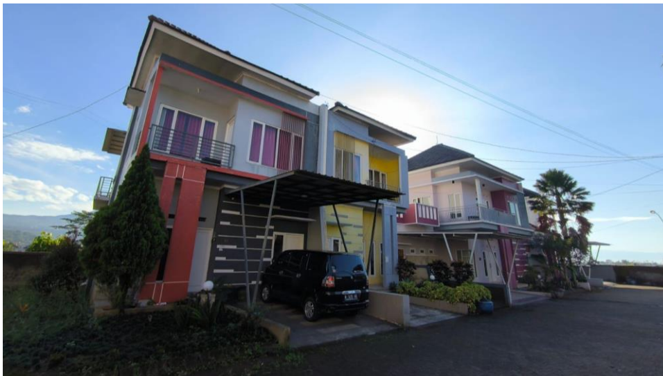
Gambar 2. Kawasan perumahan yang beralih fungsi menjadi Vila.

Dengan demikian, penelitian ini berusaha menjawab pertanyaan: Bagaimana karakteristik dan dampak keberadaan vila ilegal di Indonesia, khususnya di Kota Batu, serta kebijakan apa yang efektif untuk mengendalikannya dalam kerangka pembangunan pariwisata berkelanjutan?