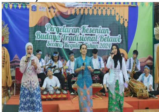
Gambar 2. Pertunjukan Gambang Kromong