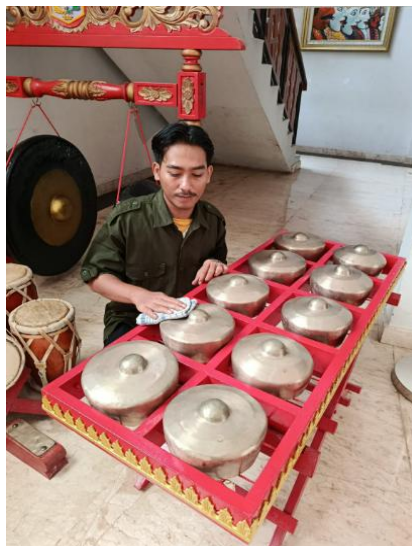
Gambar 3. Perawatan Instrumen Musik Gambang Kromong