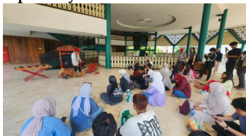
Gambar 4. Workshop Budaya

Setu Babakan secara aktif menjalankan program workshop pengenalan budaya Betawi, yang mencakup seni tari dan eksplorasi kuliner khas Betawi, dengan melibatkan berbagai sekolah. Inisiatif ini bertujuan untuk menanamkan kecintaan dan pengetahuan mendalam tentang warisan budaya kepada generasi muda sejak dini. Mengadakan workshop langsung di sekolah-sekolah terbukti sangat efektif dalam memperluas jangkauan pelestarian budaya, melampaui batas kawasan Setu Babakan hingga ke komunitas yang lebih luas. Hal ini tidak hanya memperkuat identitas budaya di kalangan siswa, tetapi juga secara signifikan meningkatkan pemahaman dan apresiasi mereka terhadap Gambang Kromong.