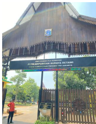
Gambar 1. Pintu Gerbang Perkampungan Betawi Setu Babakan

Seiring berkembangnya zaman, generasi muda saat ini diketahui tidak terlalu mengenal musik yang ada sejak masa penjajahan Belanda ini (BBC News Indonesia, 2018) karena Gambang Kromong seringkali dianggap sebagai seni yang digemari oleh orang tua saja. Sehingga ketenaran Gambang Kromong mengalami penurunan peminatan (Genpi.id, 2020). Dilansir dari Kumparan (2021), modifikasi Gambang Kromong yang telah dilakukan masih belum bisa menarik perhatian generasi muda karena kurangnya kesadaran generasi muda terhadap budaya. Selain itu, berkurangnya penduduk Betawi di Jakarta atau berkurangnya lahan untuk pertunjukan musik Gambang Kromong semakin sedikit juga mempengaruhi (Radio Republik Indonesia, 2024) Namun, di tengah tantangan tersebut masih ada desa wisata di Jakarta Selatan yang berhasil membuktikan bahwa musik gambang kromong masih dapat hidup dan berkembang yaitu Setu Babakan (Muthoharoh, 2023).