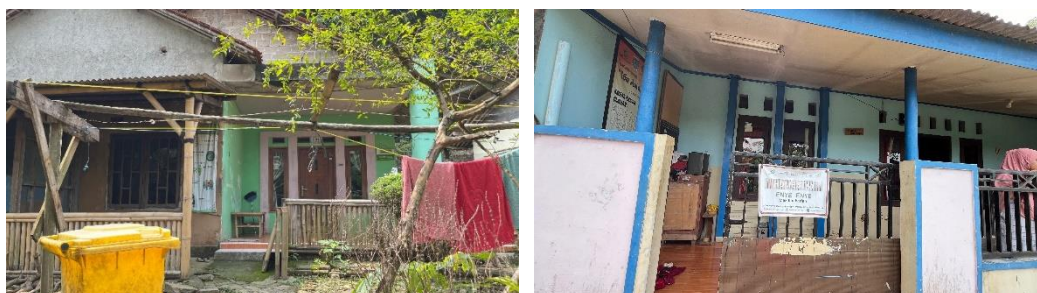
Gambar 2. Homestay

Homestay adalah akomodasi yang berbentuk tempat tinggal masyarakat dimana wisatawan dapat tinggal bersama dengan pemilik rumah dan berpartisipasi dalam aktivitas sehari-hari masyarakat (Dewi dan Darmaesti, 2023).