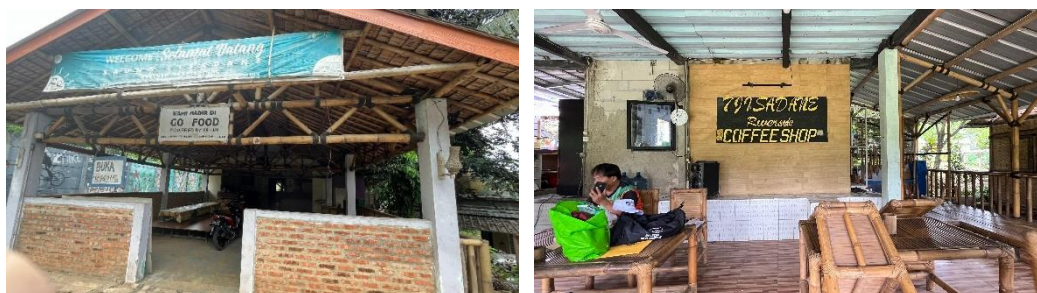
Gambar 3. Tempat makan & Coffee Shop