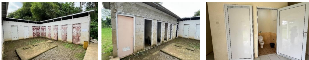
Gambar 4. Toilet umum

Pada gambar 4 dapat terlihat kondisi toilet yang ada di Kampung Wisata Keranggan. Menurut hasil wawancara dengan Sekretaris Pokdarwis Bapak Abdul Basyith mengenai toilet umum adalah toilet ini menyediakan fasilitas air, kloset jongkok, kloset duduk untuk penyandang disabilitas, bak mandi yang menggunakan ember dan gayung. Beberapa hal yang masih membutuhkan optimalisasi adalah penampungan air di beberapa titik yang instalasinya masih kurang sehingga mempengaruhi pembagian air pada tiap bilik toilet. Hal ini menyebabkan tidak meratanya kuantitas air yang tersebar.