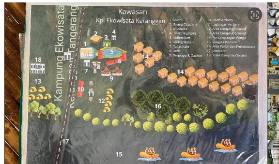
Gambar 1 Peta Kawasan Ekowisata Keranggan

Secara keseluruhan, Kampung Keranggan menawarkan berbagai wisata yang mencakup mulai dari hiking di hutan dan menyusuri sungai hingga penginapan dan memanah dasar. Studi awal telah menunjukkan bahwa masih ada ruang untuk perbaikan dalam administrasi dan pengembangan desa wisata, tetapi pekerjaan lebih lanjut diperlukan untuk mengevaluasi dan menggunakan langkah-langkah optimalisasi yang berhasil. Komunitas ini sangat bersemangat untuk menjadi pusat wisata utama karena lingkungan alamnya yang sangat indah dan masih alami serta fakta bahwa beberapa penghuninya adalah pelaku UMKM industri rumahan.