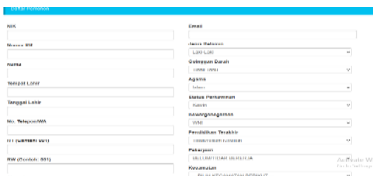
Gambar 1. Pendaftaran Akun di SIPRAJA

Inovasi ini bukan sekedar bentuk adaptasi terhadap perkembangan teknologi, tetapi juga mencerminkan implementasi nyata dari prinsip otonomi daerah, yang mendorong pemerintah lokal untuk lebih mandiri dan kreatif dalam memenuhi hak serta kebutuhan masyarakatnya. Sistem Pelayanan Rakyat Sidoarjo (SIPRAJA) merupakan penyelenggaraan pelayanan publik yang berbasis teknologi informasi, yang diwujudkan dalam bentuk aplikasi digital berbasis Android [8]. Aplikasi SIPRAJA terkoneksi dengan seluruh kecamatan dan kelurahan di Sidoarjo. Sehingga Masyarakat memanfaatkannya untuk melakukan pelayanan tanpa datang ke instansi yang terkait. Aplikasi ini dapat diunduh melalui platform Play Store serta dapat diakses melalui portal resmi Kabupaten Sidoarjo, sehingga memudahkan masyarakat dalam mengakses berbagai layanan administrasi secara daring melalui ( https://SIPRAJA.sidoarjokab.go.id/ ). SIPRAJA dapat digunakan melalui perangkat smartphone maupun laptop. Langkah awal masuk ke laman menu aplikasi tersebut. Selanjutnya adalah melakukan pembuatan akun SIPRAJA dengan tekan daftar pada bagian pojok kanan atas. Setelah itu akan muncul tampilan data pemohon yang harus dilengkapi. Berikut adalah tampilan isi data pemohon yang harus dilengkapi untuk pendaftaran akun: