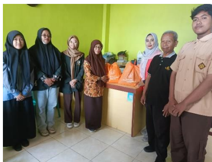
Gambar 2. Penyaluran sembako melalui balai desa