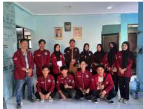
Gambar 3. Tahap observasi dan wawancara Gambar. 4 Koordinasi dengan pihak Kelurahan Kilasah

Hasil observasi tersebut didapatkan informasi bahwa Makam Kramat Nyi Buyut Si Jorog berdiri sejak kesultanan Banten, Sang Juru Kunci diberikan tugas mengelola makam sejak tahun 1973, akan tetapi wisata religi yang telah berdiri selama puluhan tahun tersebut hingga era teknologi Industri 5.0 masih belum dikenal oleh masyarakat luas, wisatawan atau peziarah hanya berasal dari penduduk setempat saja. Selain terletak di sebuah perkampungan, tidak adanya sumber daya manusia yang tergabung dalam kelompok sadar wisata (pokdarwis) minimnya penguasaan teknologi informasi, tidak adanya penggerak untuk penciptaan media promosi menjadi faktor utama kemunduran wisata religi tersebut. Meskipun terdapat organisasi pemuda yang bernama Remaja Islam Kilasah (Riski), namun belum ada gerakan atau program pengembangan wisata religi Makam Kramat Nyi Buyut Si Jorog. Sehingga Sang Juru Kunci tidak mendapatkan pemasukan, hanya mengandalkan keihlasan dan kerelawanan saja untuk menjaga, membersihkan dan mengelola makam sebagai imbas dari sepingnya pengunjung (Peziarah).