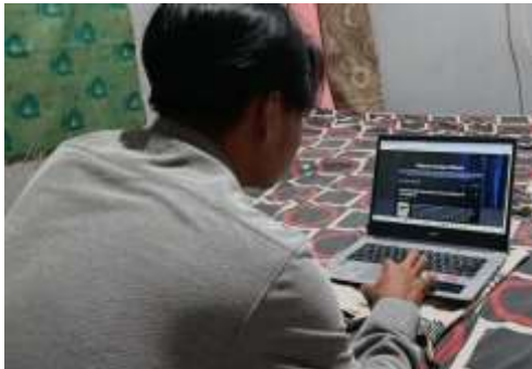
Gambar. Proses Pembuatan Blogg dan video Youtube

meningkatkan perekonomian daerah dan pemberdayaan masyarakat yang berdaya saing, serta meningkatkan tata kelola pemerintahan yang baik”.