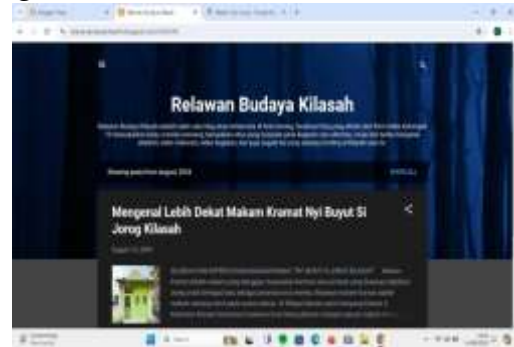
Gambar. Tampilan Blogg Wisata Religi Makam Kramat Nyi Buyut Si Jorog

Penguasaan teknologi informasi yang dimiliki oleh tim PkM sangat menentukan keberhasilan terlaksananya program, maka dalam pembuatan blog dan youtube ini sangat memperhatikan teknik-teknik ilmiah, standar etika berteknologi informasi, pemilihan gaya bahasa yang baik dan benar, serta penentuan tata letak, serta penentuan fitur-fitur informasi yang harus ada di dalamnya.