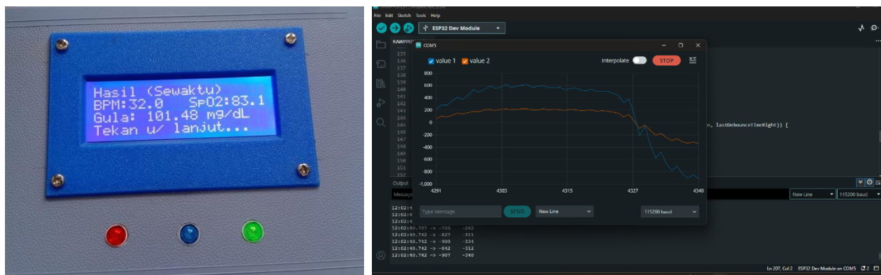
Gambar 2: Tampilan Perangkat

Penelitian ini bertujuan untuk membangun dan mengevaluasi model estimasi kadar glukosa darah non-invasif berdasarkan sinyal photoplethysmography (PPG). Bab ini menyajikan hasil dari analisis data yang telah dilakukan dan pembahasan mendalam terhadap temuan yang diperoleh.