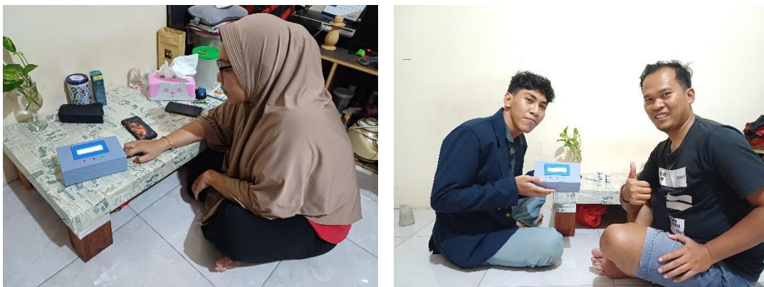
Gambar 4: Pengujian Perangkat

Namun, temuan mengenai penurunan akurasi pada subjek lansia dengan kondisi puasa menjadi hasil penelitian yang krusial, yang menyoroti perlunya pengembangan model yang lebih adaptif dan tangguh terhadap variasi sinyal PPG pada penelitian selanjutnya.