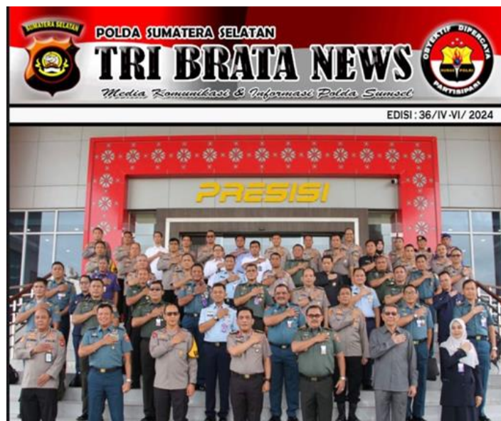
Gambar 1. In-House Magazine Polda Sumsel

Berupa majalah fisik yang dicetak dan di distribusikan secara berkala yaitu satu kali dalam tiga bulan, berisi informasi yang mendalam, laporan khusus, dokumentasi kegiatan kepolisian. In-house magazine memiliki penyebaran yang bersifat terbatas hanya pada kalangan internal kepolisian serta beberapa pihak yang terkait seperti instansi pemerintahan.