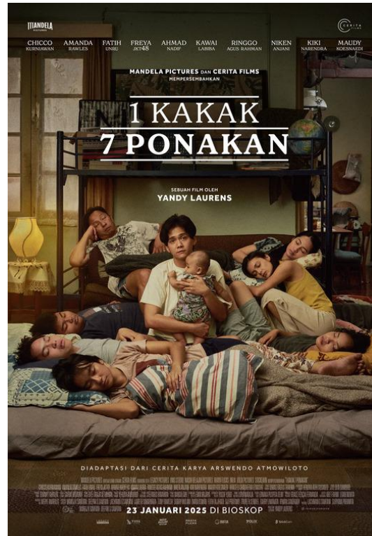
Gambar 1. Poster Pertama Film 1 Kakak & Ponakan

Berdasarkan observasi terhadap poster film "1 Kakak 7 Ponakan" yang pertama, dapat dijelaskan bahwa poster film ini dibuat untuk film dengan judul yang sama yang rilis di bioskop pada tanggal 23 Januari 2025. Poster film ini dirancang oleh Evan Wijaya dan foto poster diambil oleh Yusuf Yudo. Pada poster tersebut terdapat empat figur laki-laki dan empat perempuan. Seorang laki-laki berada di tengah dengan posisi duduk seraya menggendong seorang bayi perempuan. Semua figur lain di sekelilingnya sedang tidur. Terdapat kasur yang berada di lantai serta ranjang tingkat dua. Terdapat banyak barang-barang seperti lampu berwarna kuning, bantal, buku, globe, kursi dan barang-barang rumahan lain. Warna lantainya yakni coklat dan temboknya berwarna putih kusam.