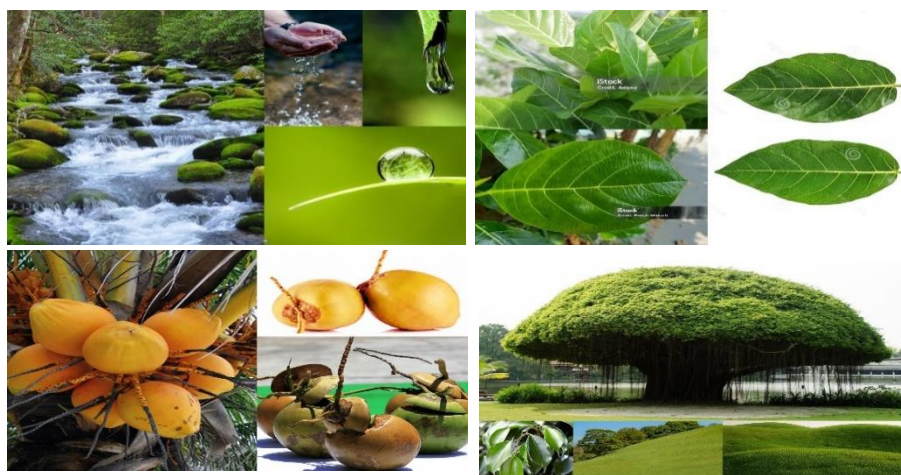
Gambar 2. Study visual

Studi Visual Dalam studi visual penulis berusaha menangkap semua objek yang bisa diindera secara visual dalam upacara Huler Wair. Berikut visual yang penulis peroleh: