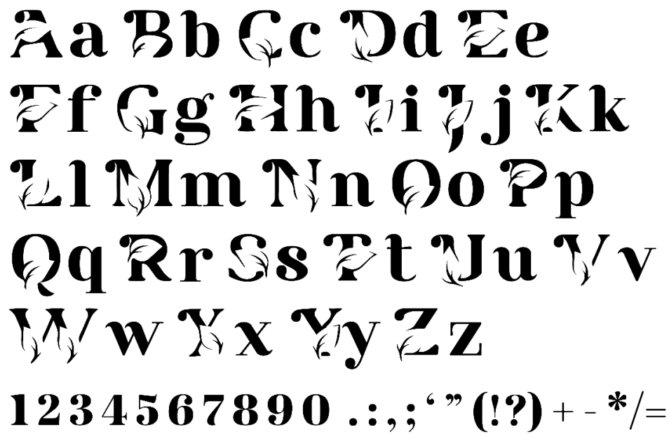
Gambar 5. Typeface huler wair