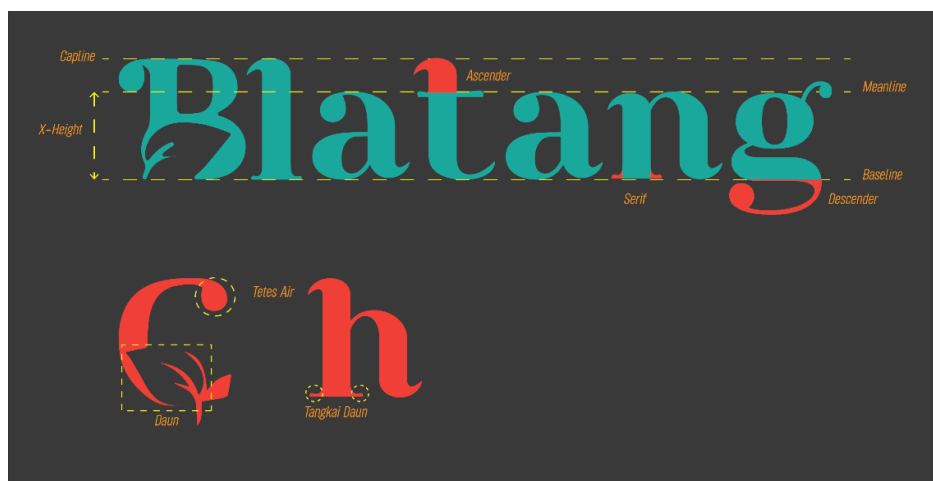
Gambar 4. Anatomy huler wair