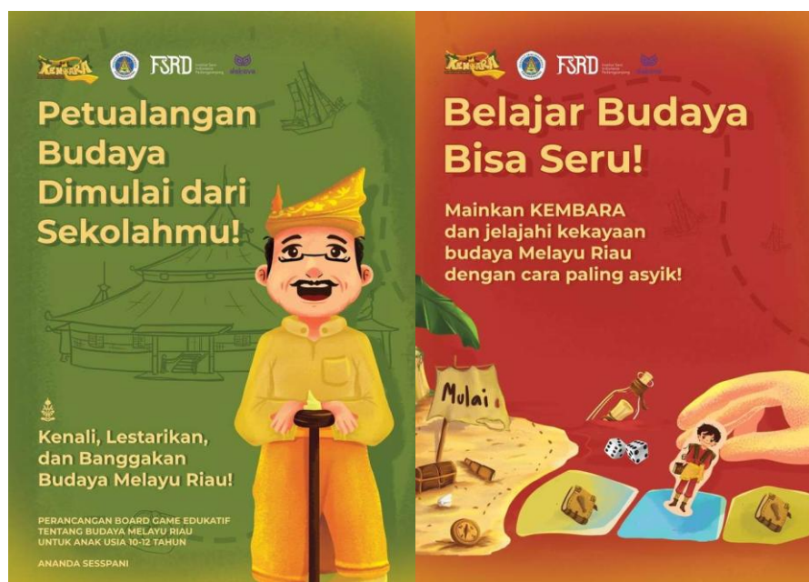
Gambar 3. Poster "KEMBARA"

Poster berukuran A3 didesain sebagai media promosi utama permainan. Poster menampilkan visual tokoh utama permainan, logo "KEMBARA", tagline edukatif, dan ilustrasi elemen budaya Melayu. Warna cerah dan ilustrasi kartun digunakan untuk menarik perhatian anak-anak maupun orang tua.