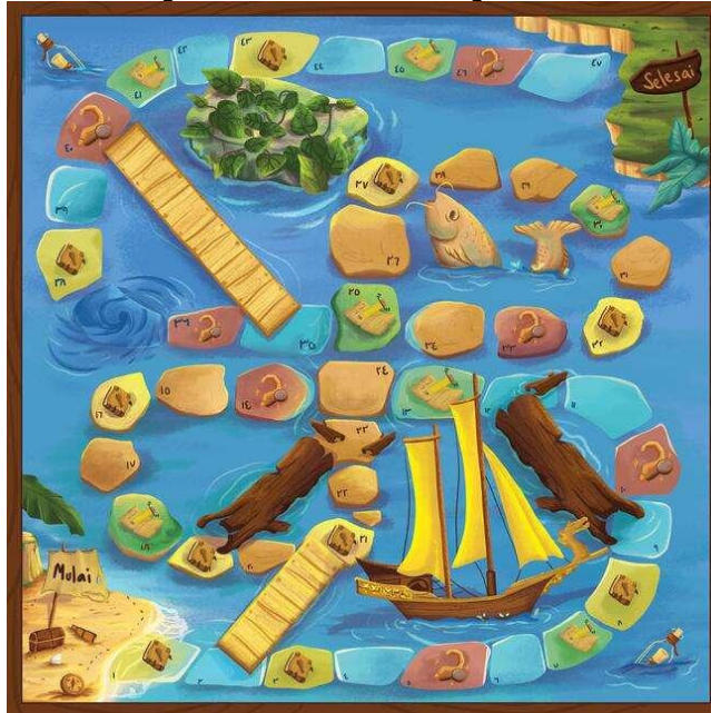
Gambar 1. Papan permainan "KEMBARA"

tentang cara bermain dan aturan permainan. Kotak kemasan (packaging) didesain dengan ilustrasi karakter serta sesuai dengan tema yang diangkat yaitu petualangan, untuk menarik perhatian dan memperkuat kesan etnik.