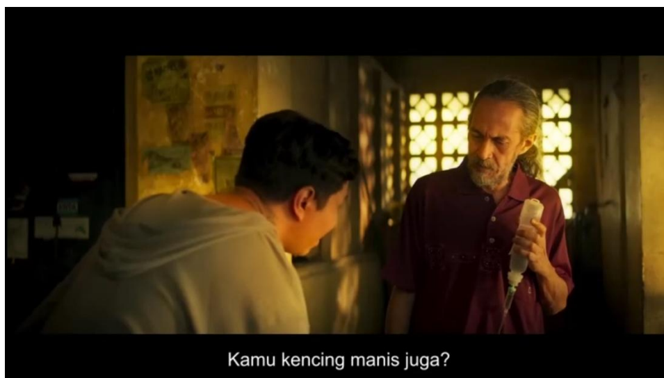
Gambar 4. 1 Pesan Moral Kasih Sayang dan Keakraban Keluarga