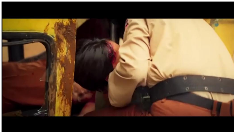
Gambar 4. 8 Pesan Moral tentang Pengorbanan dan Cinta Tanpa Syarat dari Keluarga

Analisis semiotik terhadap adegan ini meliputi menurut Roland Barthes denotasi, konotasi, dan mitos untuk menyingkap pesan moral yang tersirat di balik tindakan pengorbanan dan cinta yang melampaui batas kematian.