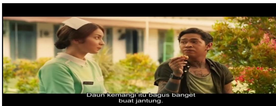
Gambar 4. 7 Pesan Moral tentang Kasih Sayang Ibu dan Nilai Kenangan dalam Hidup

Adean berikut menggambarkan pesan moral tentang kasih sayang ibu dan nilai kenangan dalam hidup, yang menjadi salah satu momen paling emosional dalam film Hello Ghost . Melalui dialog sederhana antara Kresna dan Linda, penonton diajak menyadari betapa kuatnya peran kenangan dan cinta seorang ibu dalam membentuk nilai moral anak. Dengan pendekatan semiotika Roland Barthes, makna moral dalam adegan ini dapat dianalisis dari denotasi, konotasi, dan mitos.