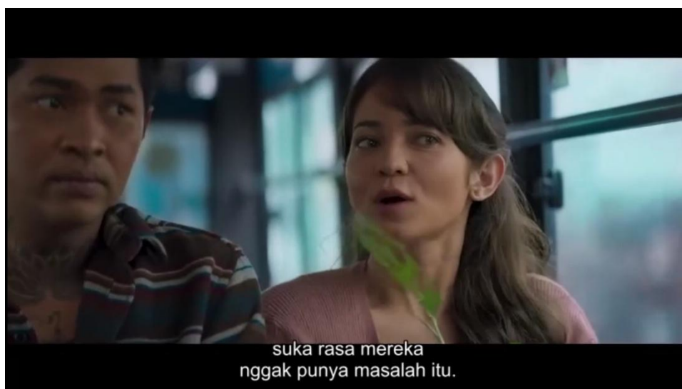
Gambar 4. 3 Keberanian Menghadapi Masalah dan Sadar Diri