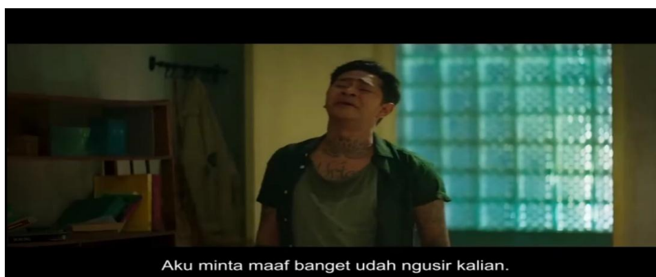
Gambar 4. 5 Pesan Moral Keikhlasan dan Penyesalan

Adegan berikut menggambarkan nilai moral berupa keikhlasan dan penyesalan yang muncul dari kesadaran diri Kresna setelah memahami makna kehadiran para arwah di sekitarnya. Analisis ini menggunakan pendekatan semiotika Roland Barthes yang mencakup denotasi, konotasi, dan mitos.