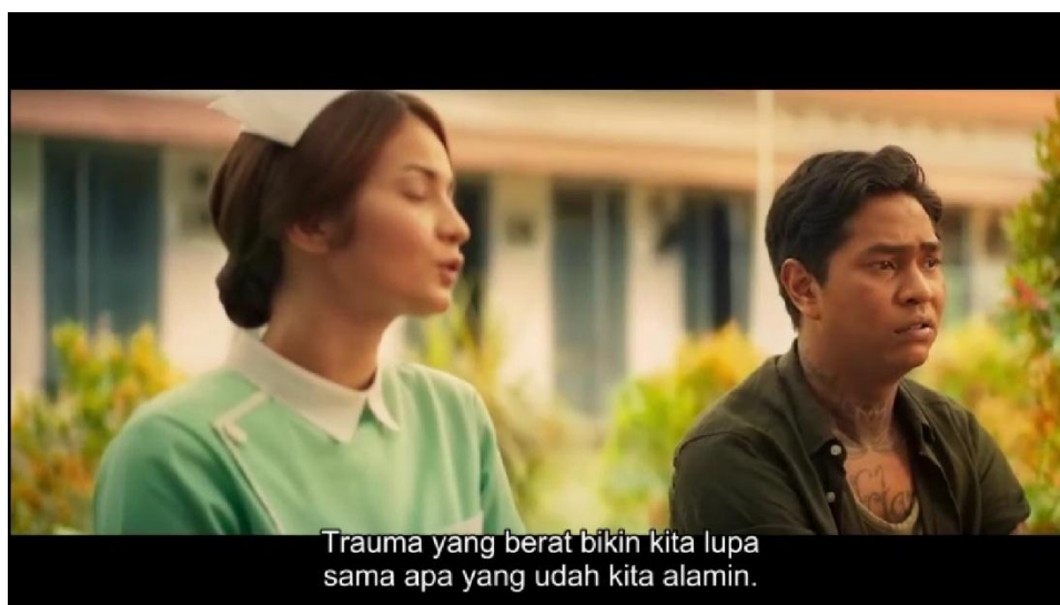
Gambar 4. 6 Pesan Moral Penyembuhan Diri dan Kesadaran Emosional