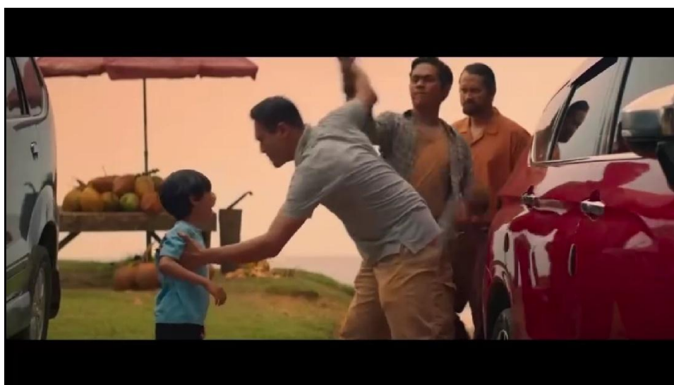
Gambar 4. 4 Pesan Moral Tanggung Jawab dan Kepedulian terhadap Sesama

Adegan berikut menyoroti nilai moral berupa tanggung jawab dan kepedulian terhadap sesama, yang nampak dari tindakan Kresna ketika menyaksikan kekerasan di ruang publik. Analisis semiotika Roland Barthes digunakan untuk melihat makna yang muncul dari lapisan denotatif, konotatif, dan mitos dalam adegan ini.