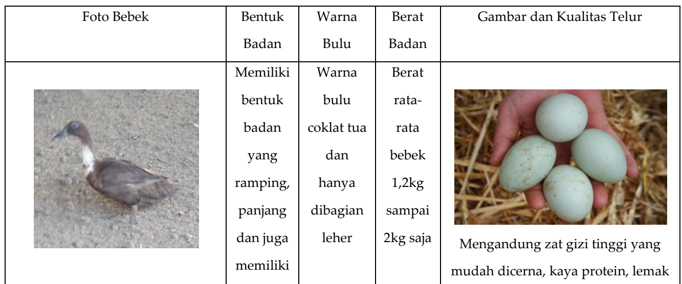
Tabel 2. Morfologi bebek makan pelet

Dedak padi adalah produk sampingan dari proses pengolahan padi menjadi beras, dengan kualitas dedak padi bervariasi tergantung pada jenis padi yang digunakan. Dedak padi merupakan salah satu produk yang dihasilkan selama proses produksi beras di pabrik penggilingan padi. Untuk mengetahui dengan pasti kandungan nutrisi dedak padi, seperti serat kasar, bahan kering, dan protein kasar, diperlukan analisis proksimat. Dalam hal ini bebek pemakan dedak memiliki bentuk badan yang ramping dan panjang serta dibagian leher relatif panjang. Dari segi warna bulu bebek ini memiliki warna bulu coklat tua, untuk berat rata-rata bebek ini hanya 1,2kg sampai 2kg saja. Telur bebek ini mengandung protein sebanyak 13,1 gram per 100 gram.