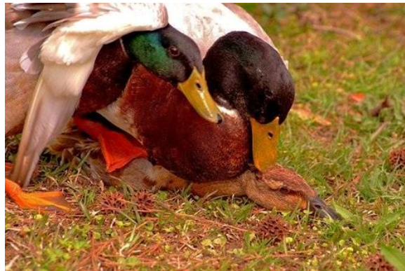
Gambar 5. Proses Perkawinan bebek

Proses perkawinan bebek terjadi ketika bebek jantan menunggangi bebek betina dan mengatur penis ke dalam vagina betina pilihan mereka. Setelah diposisikan dengan benar, penis jantan akan ke luar ke saluran telur atau vagina betina, proses ini memakan waktu sekitar sepertiga detik (Ding, 2020). Kemudian, betina membuat saluran telur mereka menerima untuk berhubungan dengan menahan ketinggian tubuh mereka dan mengangkat bulu ekornya. Bebek betina juga merilekskan dan mengencangkan dinding saluran kelamin dan membantu jantan mencapai penetrasi penuh saat berada di dalam saluran telur. Dalam hal ini, bebek jantan adalah makhluk yang cukup agresif. Faktanya, satu dari tiga peristiwa kawin bebek adalah pemerkosaan (El-katcha, 2021). Tiga atau empat ekor jantan dapat menyerang bebek betina secara bersamaan, yang mengakibatkan cedera atau bahkan kematian (Cui, 2021). Untungnya, bebek betina memiliki beberapa tindakan pencegahan yang dapat digunakan untuk menangkal serangan jantan yang tidak diinginkan (Hao, 2022). Betina dapat memposisikan tubuh mereka sedemikian rupa, sehingga mencegah penetrasi penuh dan dapat membatasi tempat penyimpanan sperma. Dalam sembilan dari sepuluh "pemukosaan", sperma yang mengganggu terperangkap di saku samping yang berada di dalam vagina dan setelah itu akan dikeluarkan. Hal ini berguna untuk mencegah kehamilan yang tidak diinginkan (Dea dkk, 2021).